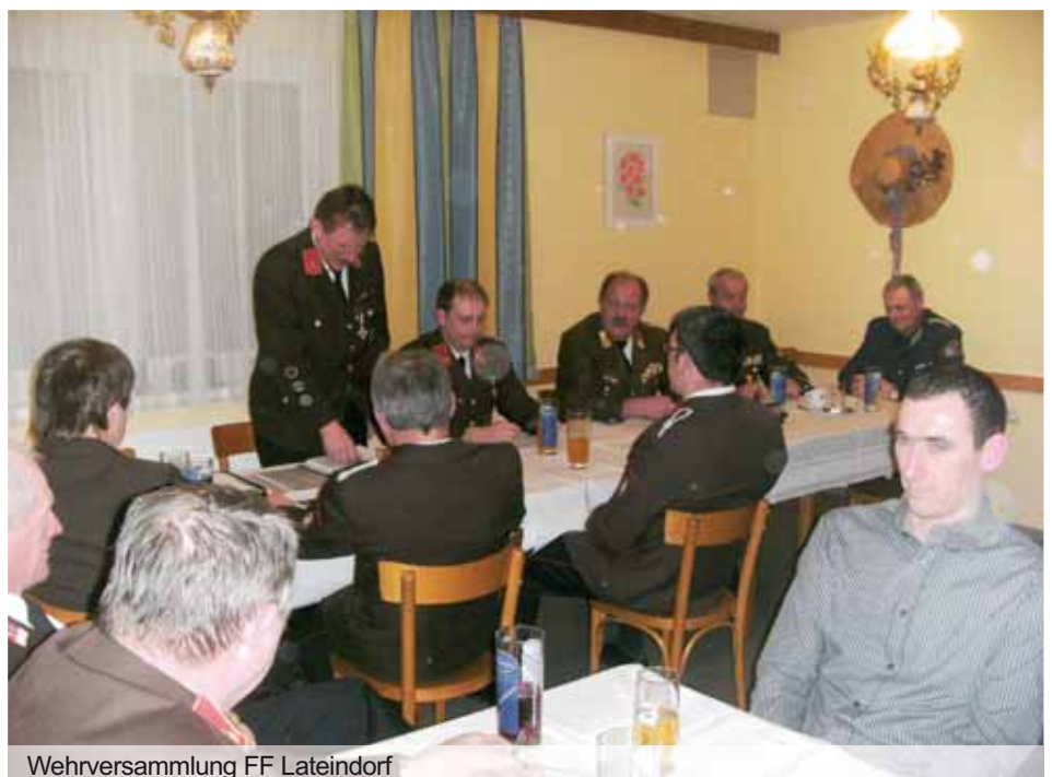
Wehrversammlung FF Lateindorf

Bergfest in Oberlatein mit den GRAZER SPITZBUAM