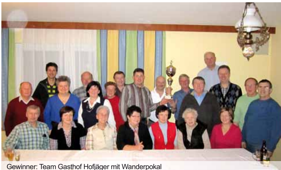
Gewinner: Team Gasthof Hofjäger mit Wanderpokal

Wir freuen uns schon jetzt und wünschen dem Team vom Gasthof Hofjäger, wie gesagt, für 1 Jahr viel Freude mit dem Wanderpokal. ■