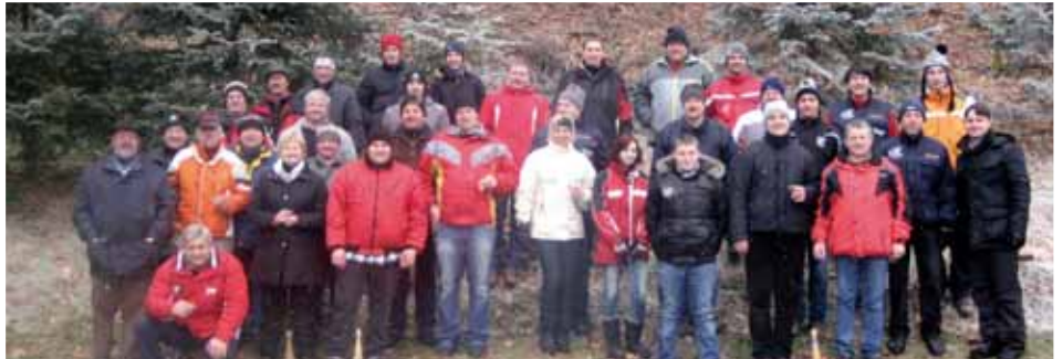
Sparverein Schwarz und FF Lateindorf bei der Knödelpartie

Es geht nicht immer nur ums Gewinnen, sondern viel mehr um Kameradschaft, Spaß und Gemeinschaft!