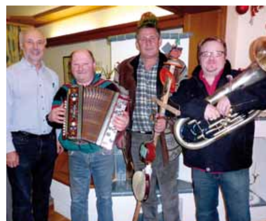
Neujahr-Geiger aus Großradl

Stamperl wird es dann oft lustig und kann auch mal etwas länger dauern. Der Bürgermeister wurde heuer von 4 Gruppen beehrt. Eine ganz junge Gruppe von Feisternitz, großteils Musikschüler der Erzherzog-Johann Musikschule Eibiswald, geigten bestens auf. Eine ganz exzellente Gruppe aus Wuggitz mit Profimusikern war ebenfalls dabei. Ein weiteres Duo aus der Soboth und sogar ein Trio aus dem Lavanttal in Kärnten stellte sich ein. ■