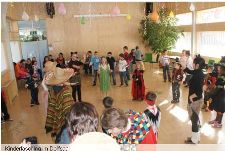
Kinderfasching im Dorfsaal