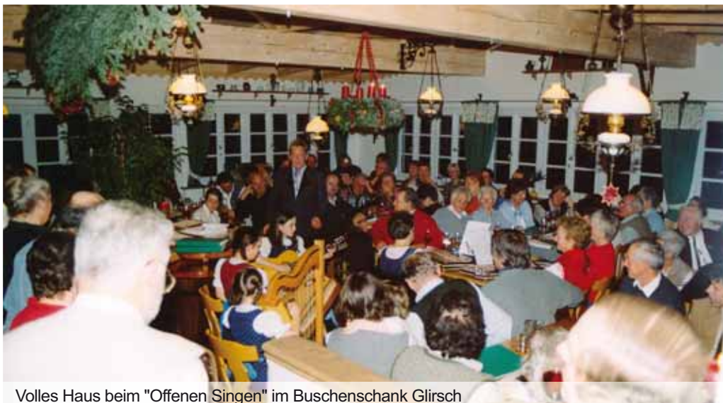
Volles Haus beim "Offenen Singen" im Buschenschank Glirsch

Wir hoffen, dass wir noch viele schöne Stunden miteinander verbringen dürfen.