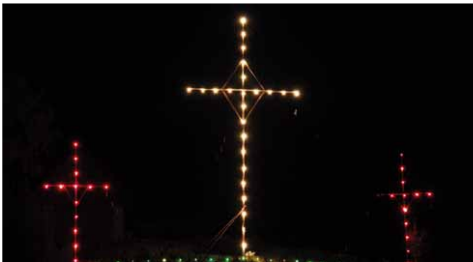
Osterkreuz: Messner, Höhe: 8,5 m

Bei weiteren Fragen stehen Ihnen die Tourismusbüros Südliche Weststeiermark (03466/43256) und Sulmtal Koralm (03467/8484) gerne zur Verfügung. ■