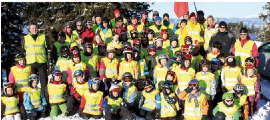
61 Kinder beim Schikurs des WSV Eibiswald-Aibl

Der WSV Eibiswald-Aichberg wünscht allen Kindern weiterhin ein "Schi-Heil" und bedankt sich bei allen, die zum erfolgreichen Abschluss beigetragen haben, recht herzlich. Wir freuen uns bereits auf 2012. ■