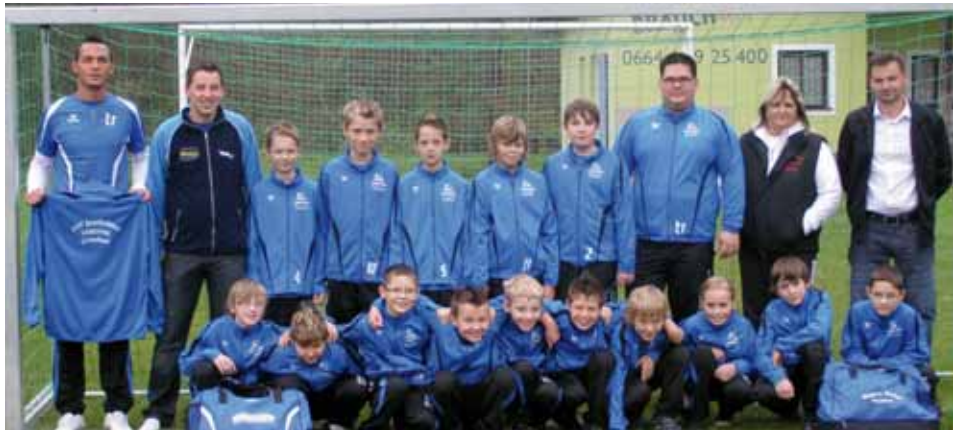
U-12 USV Grenzland