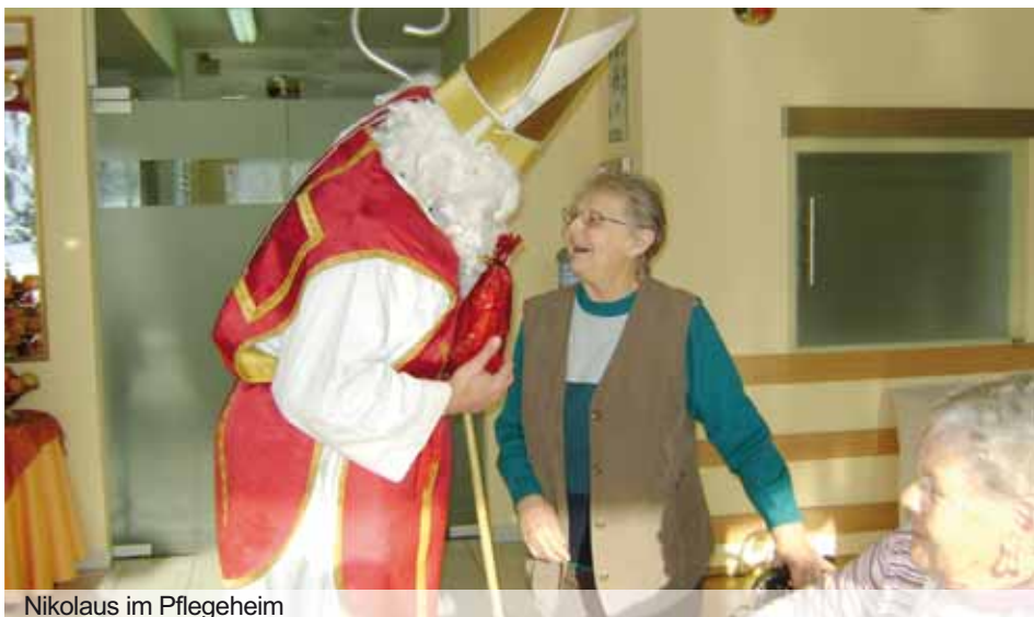
Nikolaus im Pflegeheim

Im Dezember des Vorjahres zauberte man den Menschen im Pflegeheim Kirschallee Deutschlandsberg ein Lächeln ins Gesicht. Mit viel Freude und aufwändigen Geschenken bemühte sich der Großradler Freizeitverein „Gwaetzte Haitz“ den traditionellen Brauch wieder etwas näher zu bringen. Beim Verteilen der Geschenke durch den Nikolaus mit seinen Krampussen, durfte man erfreut in die strahlenden Augen der Bewohner blicken und sehen, dass manche Bräuche und Gesten nicht nur Kinder zum Strahlen bringen können!