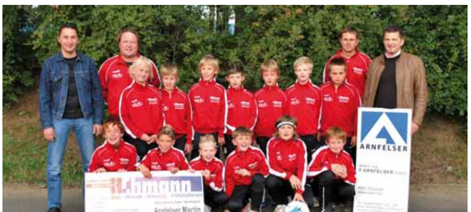
U-12 SV Eibiswald