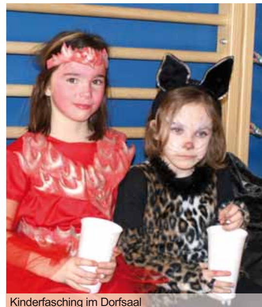
Kinderfasching im Dorfsaal