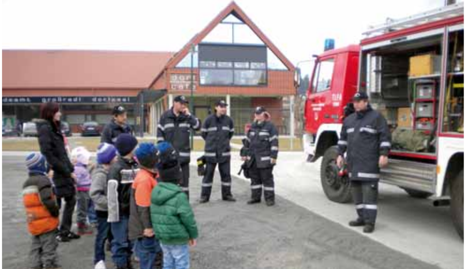
Die Feuerwehr im Kindergarten Feisternitz

Mit einer Brandschutzübung bekamen wir Einblick in den Aufgaben- und Einsatzbereich eines Feuerwehrmannes. Zur Freude der Kinder durften sich all unsere Schützlinge als echte Feuerwehrmänner verkleiden und mit dem großen Wasserschlauch Feuer löschen.