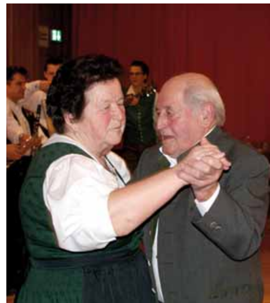
Eröffnungswalzer beim Steirerball

Viele nutzten die Möglichkeit das Tanzbein zu schwingen oder unterhielten sich bei angenehmer Lautstärke (die Musiker spielten auch dieses Jahr wieder ohne Verstärker). ■