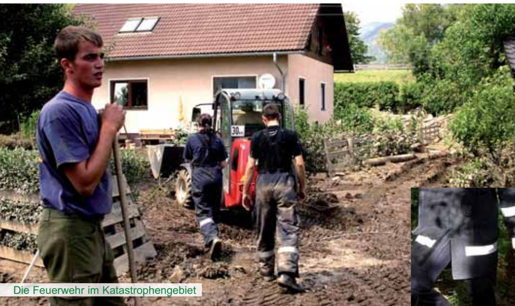
Die Feuerwehr im Katastrophengebiet