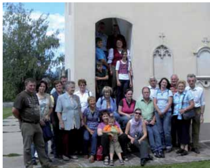
Die Kartenrunde bei ihrem Ausflug

Buschenschank Glirsch noch einmal Revue passieren und stießen mit einem guten Glas Wein voller Vorfreude auf die kommende „Bauernschnaps-Saison“ beim Gasthaus Novak an. ■