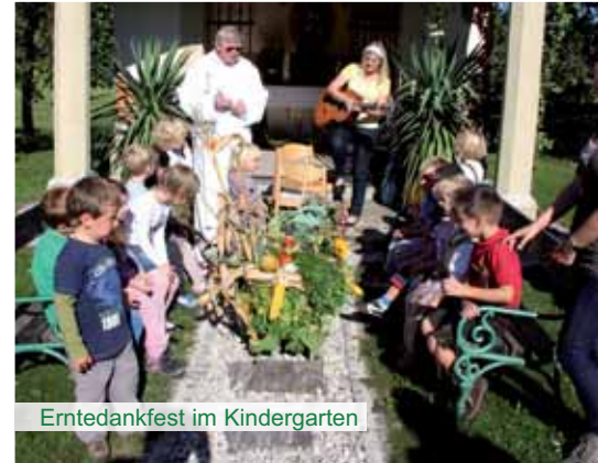
Erntedankfest im Kindergarten

Der Sommer nimmt sein „spätes“ Ende und Anfang September war wieder Schulbeginn. Wie Sie wahrscheinlich schon bemerkt haben, machen viele „Vorsicht“ Plakate auf die Schüler aufmerksam. Daher möchte ich Sie bitten,