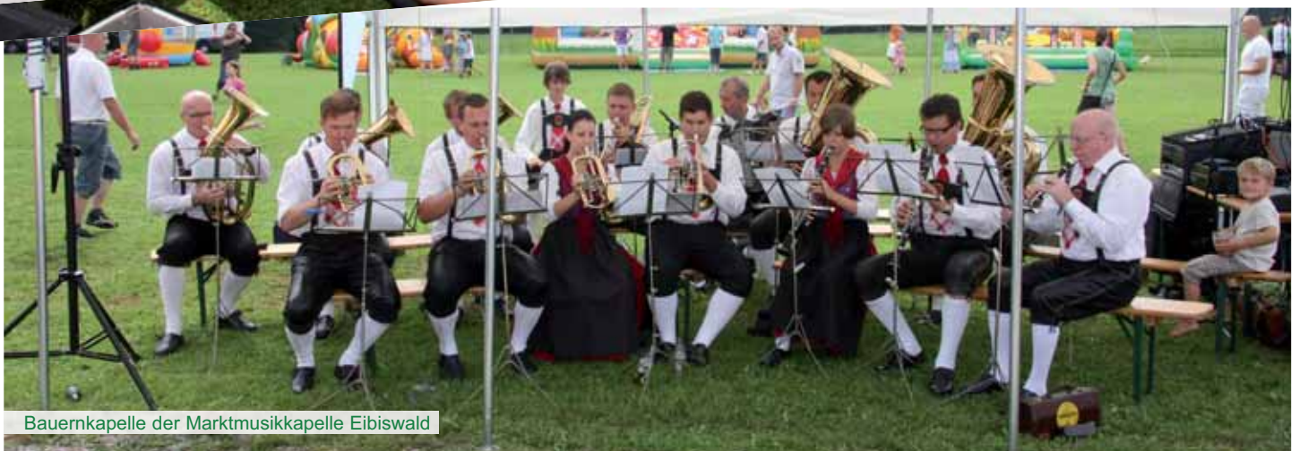
Bauernkapelle der Marktmusikkapelle Eibiswald

Ich freue mich schon auf das nächste große Spielefest im Sommer 2012. ■