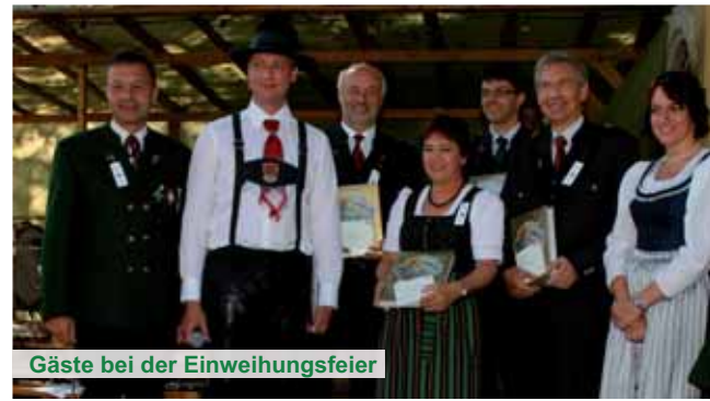
Gäste bei der Einweihungsfeier