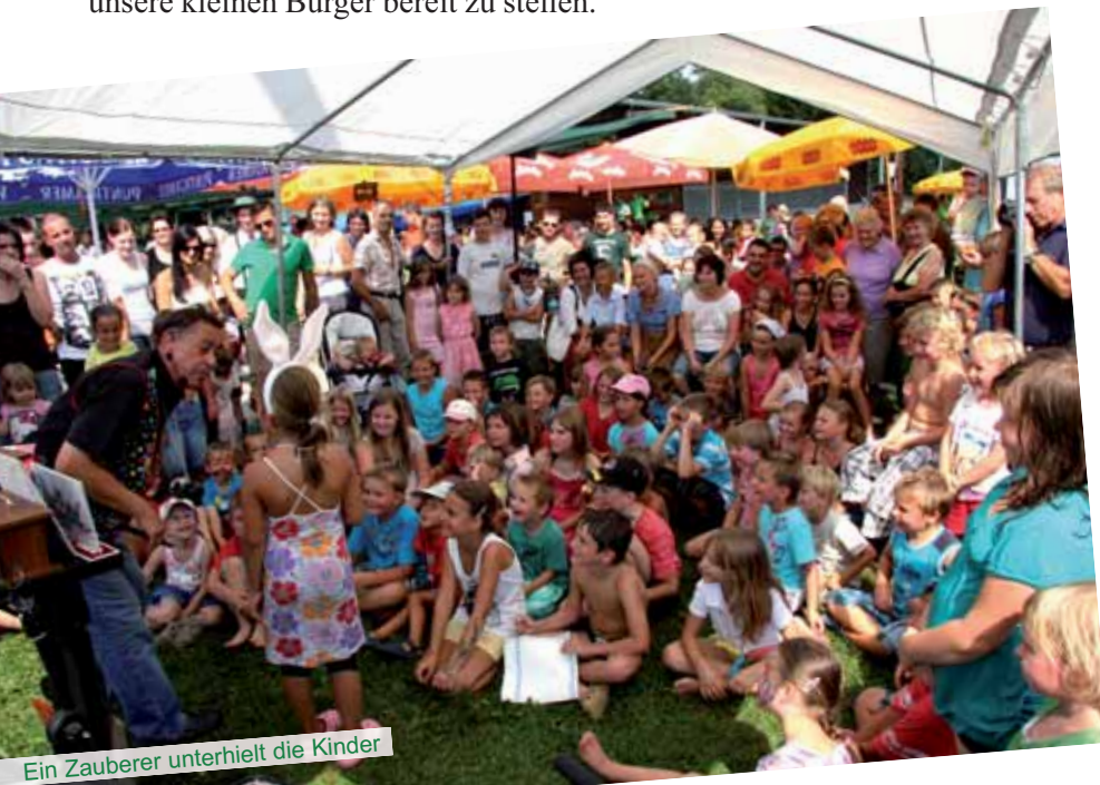
Ein Zauberer unterhielt die Kinder

So hatten bei herrlichem Wetter und angenehmen Temperaturen nicht nur die Kinder ihr Vergnügen, auch die anwesenden Eltern und Verwandten hatten beim Frühschoppen mit Musik der Bauernkapelle der Marktmusikkapelle Eibiswald und den Witzen vom „Elektro-Pepi“ gute Unterhaltung.